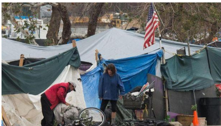
美国的不平等状况比其他很多发达国家更加严重

保守派哈德逊研究所（Hudson Institute）在2017年发布报告称，最富有的5%的美国家庭在2013年持有大约62.5%的美国资产，高于30年前的54.1%。因此，另外95%的美国人的占比从45.9%下滑到37.5%。