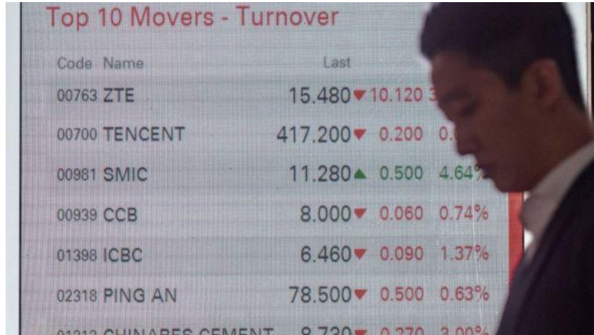
中美贸易战开打之后，中国内地和香港股市均出现了巨大跌幅

我们不妨来探讨此种可能性。在气候学上，美国的一只蝴蝶扇动翅膀引起万里之遥的中国的一场风暴，这种可能性不排除。考虑到转型时期中国社会的脆弱性，从绝对意义上讲，贸易战引发或促进一些极端情况的出现是有可能的，但要起到动摇政权的作用，似乎不是这么简单。