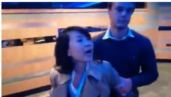
中国女记者涉打人被捕：发生了什么事

https://www.bbc.com/zhongwen/simp/world-45717070