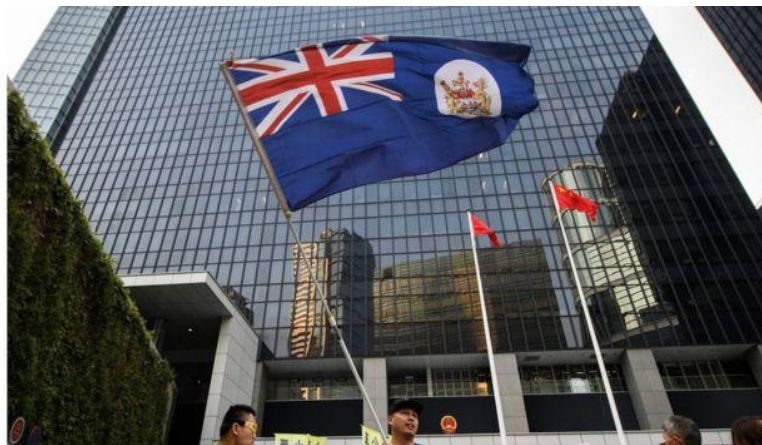
在中国国庆日，有香港示威者高举“港英旗”抗议中国政府削弱香港言论自由

中国驻英国大使馆要求保守党人权委员会“停止干涉中国内政，停止插手香港事务”，而央视发言人说，“任何鼓吹分裂中国的图谋和行为都是逆历史潮流和徒劳的”。