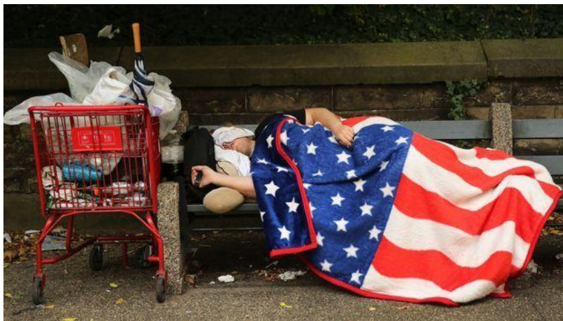
无家可归人士露宿街头

比如，新奥尔良居民的家庭平均收入为 37500 美元。贫困率为 26%，人口平均预期寿命为 76 岁。而且，这种差距已经持续了几十年（自 1980 年代开始）。