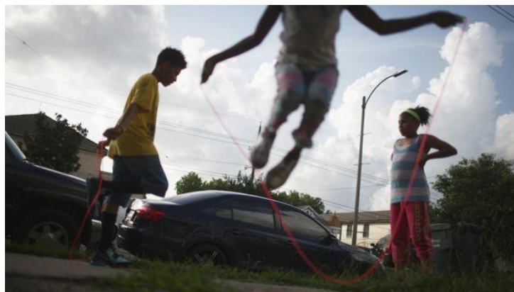
新奥尔良居民平均收入远远低于沿海城市，属于比较贫困地区

当然，这些经济和地理差异不仅限于美国黑人社区，在以西班牙语为主的社区贫困率相对也比较高。生活在这些相对比较贫穷地区的美国人面临一系列挑战：就业市场疲软，投资有限，企业家不足。而这些又都是密不可分的。