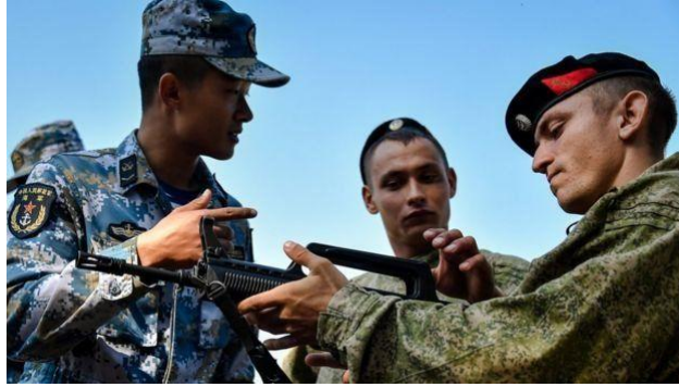
Image caption 中国军队参加俄罗斯"Vostok-2018"大规模军演。美国认为俄罗斯和中国都致力于取得对美国的军事优势。

他的报告说，中国和俄罗斯寻求在地区和全球施加更大的影响，美国及其西方盟国的关系已经被削弱，美国的一些盟国和伙伴看到美国改变安全和贸易的政策，因他们正在寻求疏远华盛顿的政策。