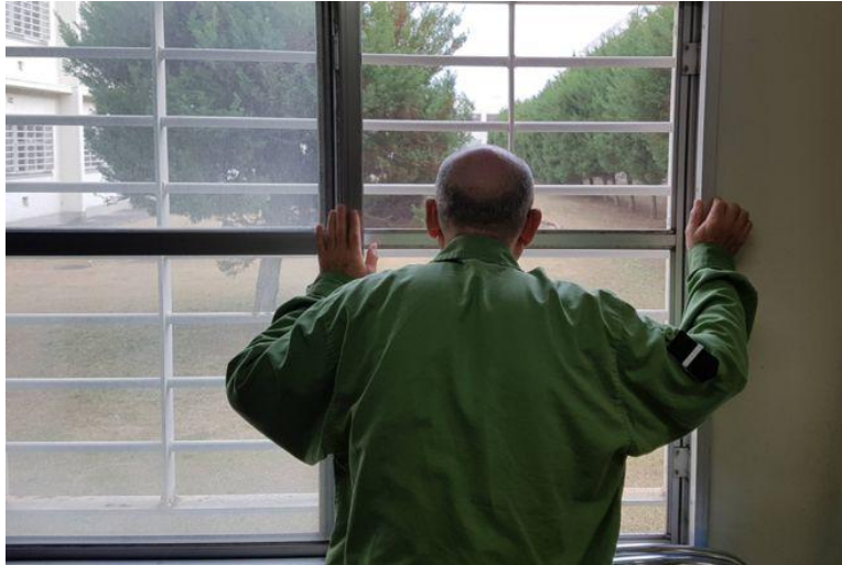
Image caption 日本监狱中的老年犯人