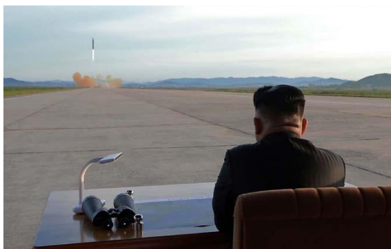
Kim Jong Un

Pekan lalu, Dewan Keamanan PBB memberlakukan pembatasan baru untuk perdagangan dengan Korut, termasuk membatasi pengiriman produk minyak hanya 500.000 barel per tahun. Guna menghukum Korut, Beijing juga tidak mengimpor bijih besi, batu bara, atau timbal dari Korut pada bulan November.