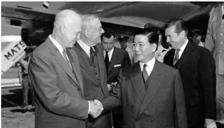
吴廷艳在美国国务卿杜勒斯陪同下在华盛顿国家机场与美国总统艾森豪威尔握手， 1963年吴廷艳在美国支持的政变中被杀。

在1975年攻陷西贡的战斗中，裴信上校随同越南人民军的坦克部队最早攻入南越总统府。是他在那里接受了南越最后的领导人杨文明投降。当杨文明表示他正在等待向人民革命政府移交权力时，裴信冷冷地说：“不存在你移交权力的问题。你的权力早就瓦解了。你不能移交你不拥有的东西。”