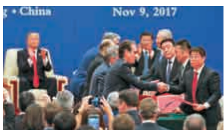
▲11月9日，中美企業簽署總額約2535億美元的商業合同和投資協議

辛識平認為，合作是唯一正確選擇，共贏才能通向更好未來。深挖合作潛力，拓展各領域互利合作，體現了兩國元首的務實努力。從互利共贏的中美經貿合作，到教育、科技、文化、衛生等領域合作，再到加強在重大國際、地區和全球性問題上的溝通與合作……中美元首北京會晤再次證明，只要堅持合作這個最大公約數，中美關係發展就有了正確方向，就能給兩國人民帶來實實在在的利益。