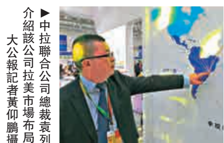
介紹該公司拉美國際市場布局

袁列說，目前「中拉中心」已展開招商工作，並啓動了同雙邊政府、企業的推廣和合作計劃。未來兩年，還將拓展和布局在拉美其他國家的分支網絡（墨西哥、阿根廷、哥倫比亞等），逐步搭建覆蓋整個拉美地區的線上線下的園區網絡，幫助更多的中國企業更快更好地進入巴西及拉美市場。