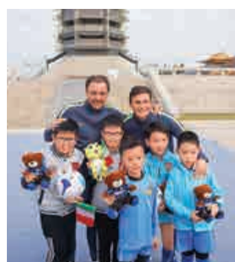
▲ 國際米蘭傳奇巨星球員向南京球迷贈送球會吉祥物公仔

大利文化月」也被定義為「再續前緣」。南京「意大利文化月」通過攝影展、電影賞析、圖書賞讀、音樂會、美食等活動，全面展示意國風土人情，讓大報恩寺與意大利「再續前緣」。在大報恩寺琉璃塔外，辛尼迪、托度、基斯普、列高巴等一代國際球星，與南京球迷「開賽」。他們輕鬆地展示運球、傳球、交叉換位、密集防守，和球迷對抗、進攻、琉璃塔再一次見證中意情誼。