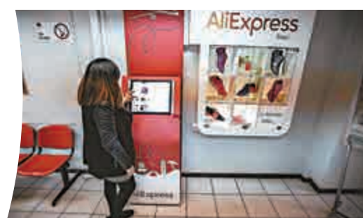
▲ 10日晚，廣州電商員工們在電腦前解答消費者購物疑問 中新社 ▲ 在智利，一女士在瀏覽阿里旗下跨境網購網站 新華社

搞定。」她說。「鼠璐璐」為自己從事的電商行業感到自豪，覺得這很時尚。上下班的交通工具選共享單車，三餐可以靠美食平台外賣，日常購物使用便捷快速的手機移動支付，過節返鄉乘坐高鐵——「鼠璐璐」過着與很多中國年輕人相仿的「新式生活」。上海第一財經傳媒首席執行官周健工分析，「新