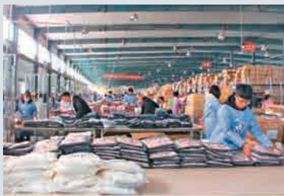
▲ 「雙11」當日，韓都衣舍倉儲中心工作人員正在備貨

進駐商務港的羊晚創意產業園負責人表示，該項目距港珠澳大橋橫琴出口僅3公里，半小時速達香港，更同時享受珠海保稅區及橫琴自貿區「雙優惠」政策，「如稅收減免、資金補貼、人才引進、創業獎勵等，這在整個粵港澳大灣區都是首屈一指的。」