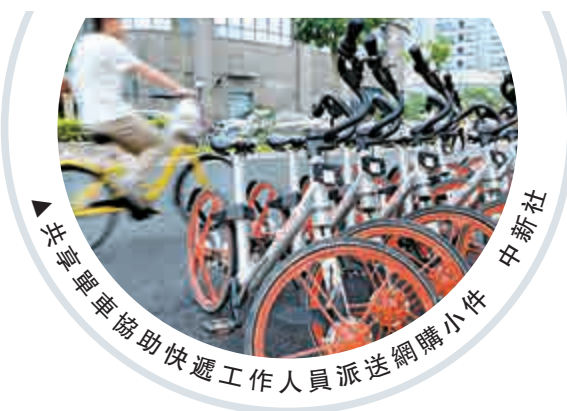
▲ 共享單車協助快遞工作人員派送網購小件