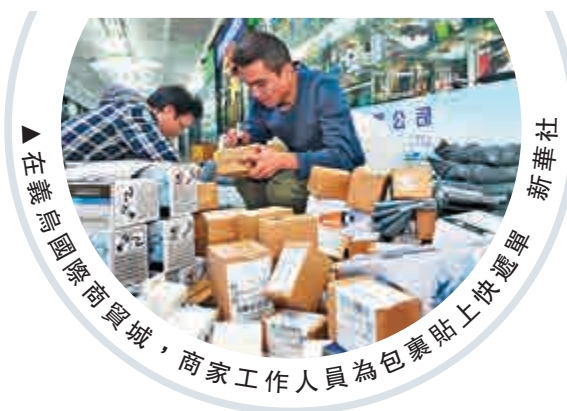
▲ 在蘇州國際商貿城，商家工作人員為包裹貼上快遞單