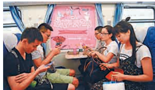
▲ 在內地「追愛」專列上，單身男女各自玩手機破尷尬

記者留意到，在「脫單」問題上男性考慮的問題更為現實，有逾六成的男性認為，「單身是因為我沒有經濟實力，難以吸引異性」；也有不少男性受訪者將單身歸咎於「家庭的壓力」和「單身男性在職場中易被安排更多工作任務」。