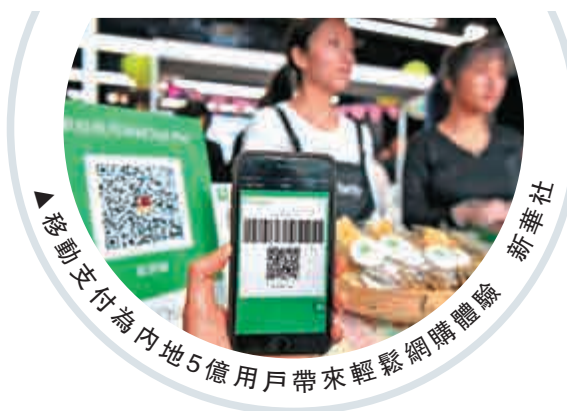
▲ 移動支付為內地5億用戶帶來輕鬆網購體驗