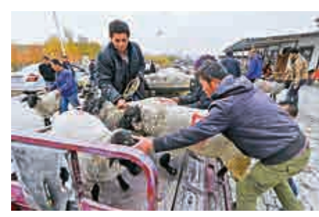
▲新疆烏魯木齊齊溝區的牧民領取優質種公羊，幫助改良肉羊品種 資料圖片

小組明確，將2018年作為脫貧攻堅工作風建設年，集中力量解決扶貧領域作風突出問題。