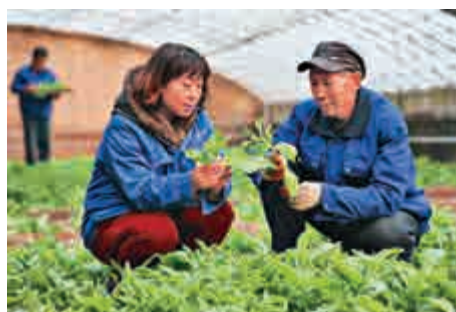
▲河北省張家口市宣化區發展特色種植業，無公害農產品直供京津 資料圖片

此外會議強調必須堅持人與自然和諧共生，走鄉村綠色發展之路；必須傳承發展提升農耕文明，走鄉村文化興盛之路；必須創新鄉村治理體系，走鄉村善治之路；必須打好精準脫貧攻堅戰，走中國特色減貧之路。