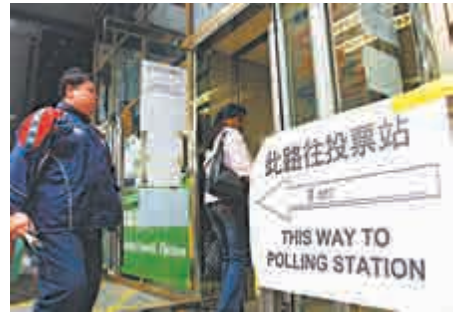
▲香港研究協會公布「311」立會補選最新民調，近半選民投票時，着重候選人的「經濟民生政策」 資料圖片