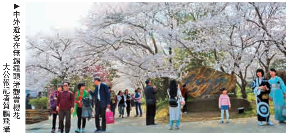
▲中外遊客在無錫鼈頭渚賞櫻

日美駐滬總領事片山和之表示,從31年前種下的1500株櫻花,到如今的近3萬株櫻花,「無錫國際賞櫻周」一年比一年熱鬧,促進了日中兩國乃至多邊國際化的交流,在日中和平友好條約締結40周年這一值得紀念的年份舉辦這樣的活動,希望能令日中關係得到進一步發展。