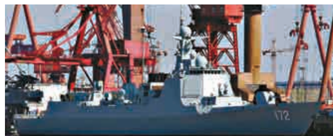
052D型導彈驅逐艦參數

排水量: 標準 3600噸 滿載 4053噸 乘員: 180人 全長: 134.1米 全寬: 16米 電戰系統: H/RJZ-726型電子對抗系統,24聯裝H/RJZ-726-4A型干擾發射裝置×2 最高速度: 不低於 27節 艦載機: 卡-28×1或直-9C×1