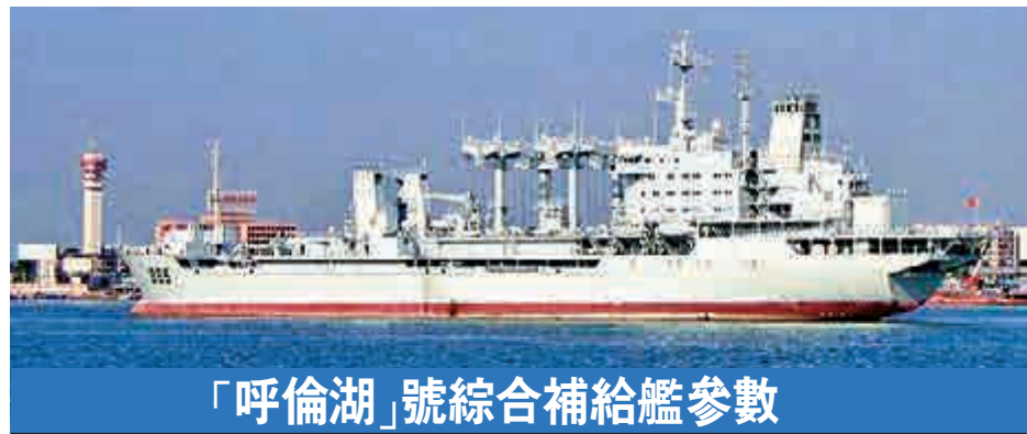
「呼倫湖」號綜合補給艦參數

排水量: 滿載 48000噸 武器裝備: 尚無數據 全長: 241米 艦載機: 尚無數據 全寬: 32米 最大補給量: 共可攜帶船用燃油10000-15000萬噸、艦載機航空煤油5000噸、淡水1000-1500噸、乾貨彈藥3000噸 最高速度: 25節