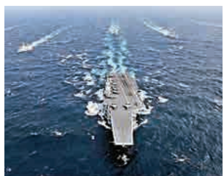
▲2017年元旦,遼寧艦與數艘驅逐艦組成編隊,攜帶多架殲-15艦載戰鬥機和多型艦載直升機在南海演練

宋忠平指出,現在解放軍各個軍兵種都在以實戰化訓練為主軸,提高打贏複雜環境下現代化戰爭的能力。這次演練中,航母已經作為核心作戰裝備參與到南海的作戰訓練中,這體現出中國未來將會強調航母的核心作用,也說明航母現在已經真正實現了戰鬥力和保障力的雙結合,未來將在維護國家主權和領土完整中發揮強大作用。