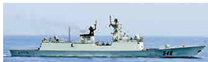
54A型導彈護衛艦參數

排水量: 標準 1300噸 滿載 1440噸 最高速度: 25節 以上 全長: 88.9米 全寬: 11.14米 乘員: 60人 艦載機: 設有直升飛機起降平台,需要時可供直-9C起降