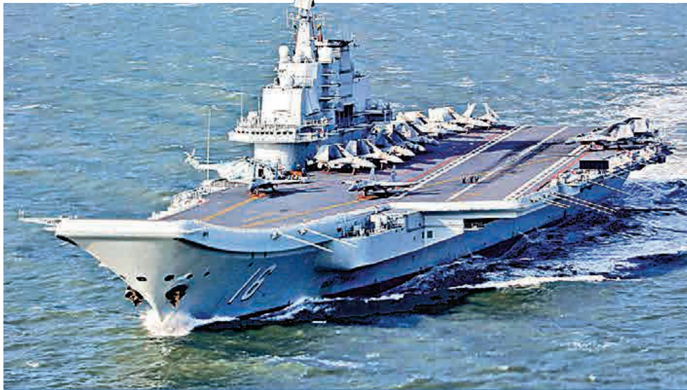
「遼寧」號航空母艦參數

排水量: 滿載 48000噸 武器裝備: 尚無數據 全長: 241米 艦載機: 尚無數據 全寬: 32米 最大補給量: 共可攜帶船用燃油10000-15000萬噸、艦載機航空煤油5000噸、淡水1000-1500噸、乾貨彈藥3000噸 最高速度: 25節