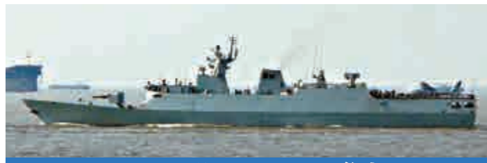
056型導彈護衛艦參數

排水量: 標準 1300噸 滿載 1440噸 最高速度: 25節 以上 全長: 88.9米 全寬: 11.14米 乘員: 60人 艦載機: 設有直升飛機起降平台,需要時可供直-9C起降