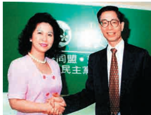
▲楊月清於個人臉書上載她與李柱銘共同創立港同盟，到民主黨時二人攝於1994年的合照