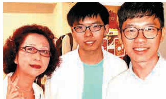
▲黃之鋒、羅冠聰深受楊月清的鍾愛