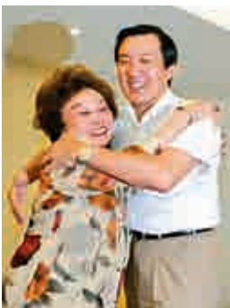
►陳香梅於二〇〇六年曾拜會當時的國民黨主席馬英九