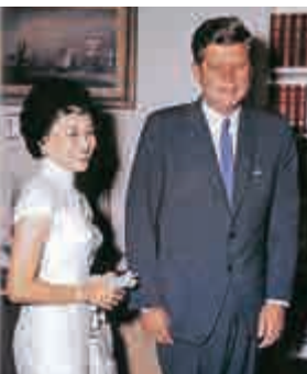
►陳香梅在與尼克松、基辛格合影