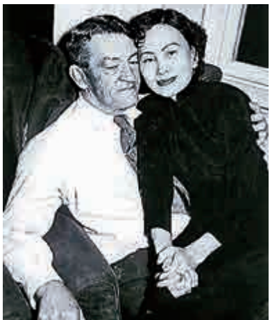
▲陳香梅與陳納德的忘年戀成為一時佳話

熱愛情，也不願意一輩子過平平淡淡沒有漣漪的生活。父親最終抵不過女兒的堅持，還是同意了婚事。1947年兩人在上海舉行婚禮。