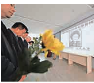
▲雲南省飛虎隊研究會4日在昆明集體悼念著名僑領、飛虎隊將軍陳納德遺孀陳香梅

測果然得到了實現，不到半年，台灣當局迫於工商界的壓力，正式開放對祖國大陸的商務活動。