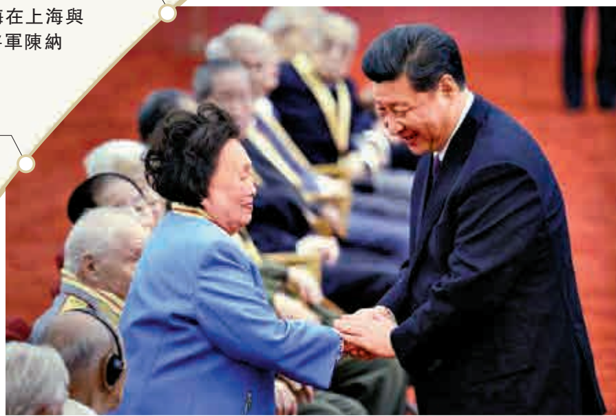
▲2015年9月2日，陳香梅受邀參加了中國人民抗日戰爭暨世界反法西斯戰爭勝利70周年紀念活動，國家主席習近平向她頒發了紀念章