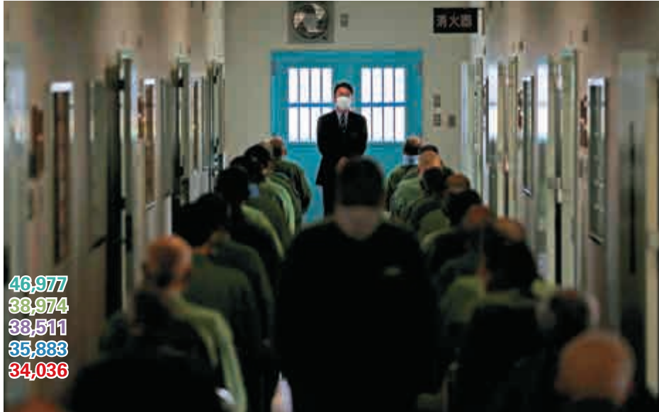
▲德島監獄的教官在監管年長囚犯做運動