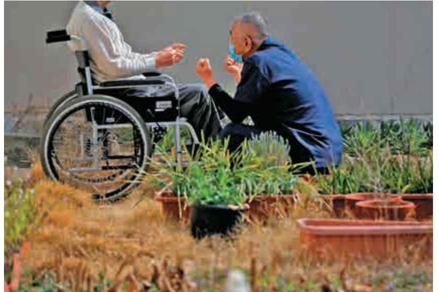
▲德島監獄一名92歲的囚犯坐着輪椅放風

【大公報訊】綜合彭博社、路透社及共同社報道：日本，這個全球人口老齡化最嚴重的國家（65歲或以上人口佔全國27.9%），如今正面臨着意想不到的挑戰：長者犯罪。由於貧窮和孤獨，被釋放後難以再融入社會等原因，年逾65歲的日本長者犯罪率增加，而「二進宮」的比例增加的幅度更令人警醒。這些老人小偷小摸或者坑蒙拐騙，就因為只有監獄才能提供「安定歸宿」。有年逾70的「慣犯」，因盜竊和詐騙曾入獄7次，惟出獄後沒有工作和住所，便不斷重走犯罪之路。