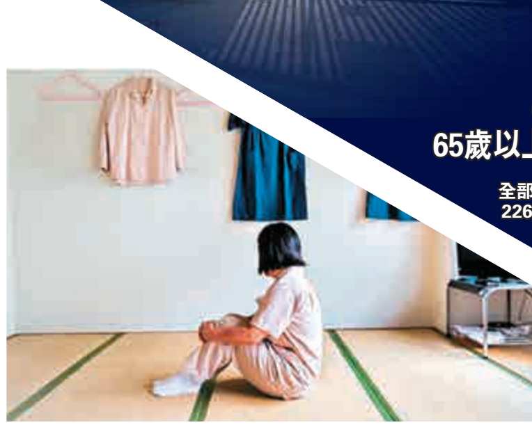
▲67歲的A女士，因偷竊衣服第一次入獄