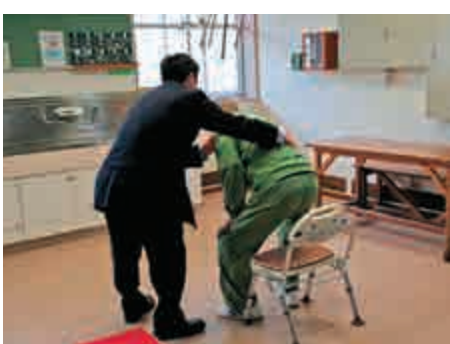
▲教官攙扶一名年長囚犯坐下

【大公報訊】綜合彭博社及路透社消息：年長體虛的囚犯也為監獄增加了負擔，去年稍早時，日本政府決定在全國84座監獄內配置護老工人。在東京以西520公里的德島監獄，為了照料年長的囚犯，當局將一座大樓改裝成「護老院」，成了日本應對銀髮族犯罪的「模範」。 「我心臟有毛病，曾在監獄的工廠暈倒。」德島監獄一名81歲的囚犯說，他60年前因為謀殺了一名的士司機並導致其他人受傷被判終身監禁。監獄規定禁止公布他的名字。他和其他大約20名囚犯，在這棟「護老院」裏生活，就餐和勞作，因為他們無法跟其他年輕力壯的囚犯一樣造鞋或縫製底褲。 日本司法部說，有關監獄如何就關押年長囚犯作出的適應和改變，他們沒有相關信息，這些決定由各個機構自身決定。在日本13座主要監獄中，很少有能夠專門為長者囚犯作出特殊安排的，但不少已經