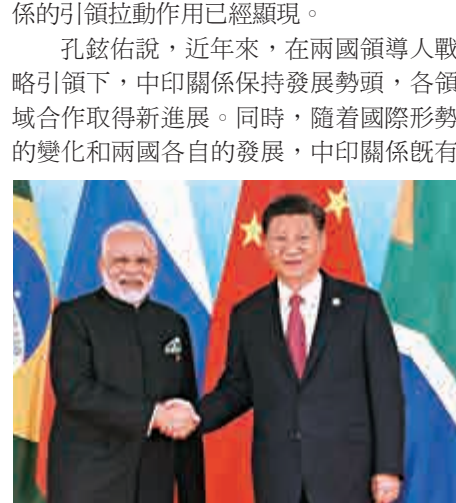
▲2017年9月4日，習近平在廈門金磚國家峰會上迎接印度總理莫迪。資料圖片

孔鉉佑說，近年來，在兩國領導人戰略引領下，中印關係保持發展勢頭，各領域合作取得新進展。同時，隨着國際形勢的變化和兩國各自的發展，中印關係既有進一步發展的需要，也面臨着進一步提升的機遇。