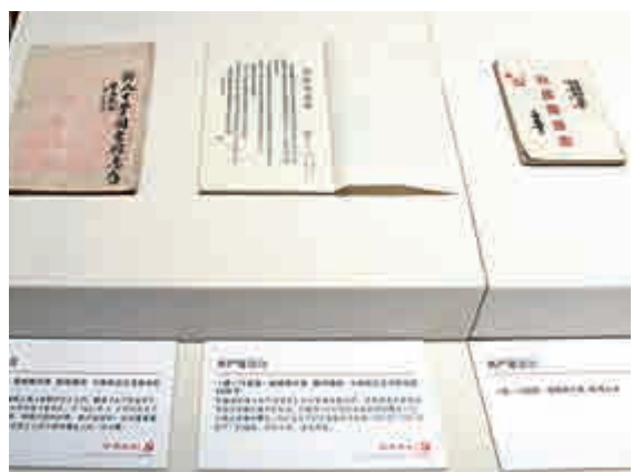
▲在國家圖書館展出的《共產黨宣言》中文譯本資料圖片

習近平指出，廣大黨員、幹部特別是高級幹部要學好用好《共產黨宣言》等馬克思主義經典著作，堅持學以致用、用以促學，原原本本學，熟讀精思、學深悟透，熟練掌握馬克思主義立場、觀點、方法，不斷提高馬克思主義理論素養。要加大經典著作編譯力度，堅持既出成果又出人才，培養一支新時代馬克思主義經典著作編譯骨幹隊伍。要深化經典著作研究闡釋，推進經典著作宣傳普及，讓理論為億萬人民所了解所接受，畫出最大的思想同心圓。