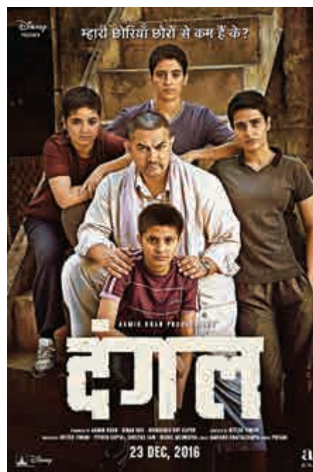
▲習近平主席與印度總理莫迪在武漢會晤時曾提到熱映的印度電影《摔跤吧，爸爸》 網上圖片

羅照輝表示，中印如何共處，如何看待彼此發展，如何判斷彼此意圖，這是關鍵問題，亟需兩國領導人戰略引領。接下來兩國領導人會頻繁碰面，除了在青島，7月南非金磚峰會、11月二十國集團阿根廷峰會上都會晤，雙方將乘武漢會晤東風，拓展雙方合作深度和廣度，為領導人會晤積累共識。