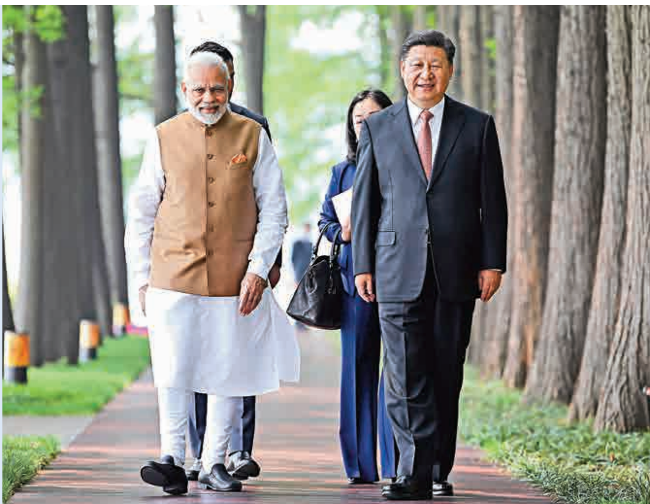
◀ 4月28日，習近平主席與印度總理莫迪在武漢舉行非正式會晤期間散步交談