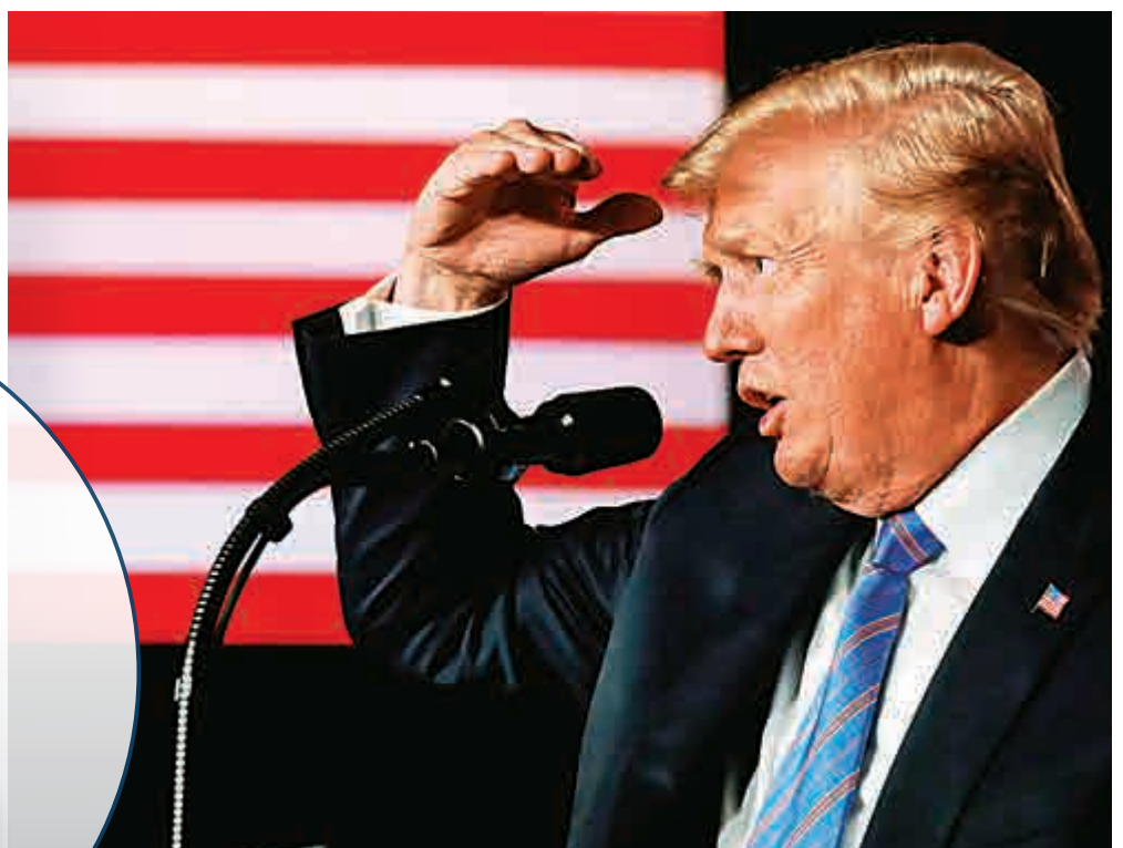
▲美國總統特朗普3日在西弗吉尼亞州出席活動