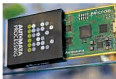
▲美國芯片製造商美光生產的記憶體芯片