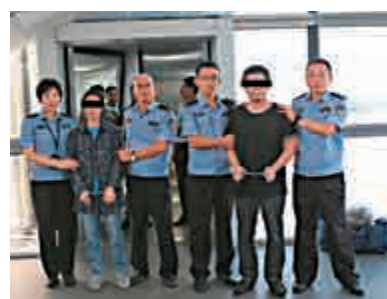
▲潛逃多年的「國際紅通」夫婦被抓獲

此外，中方去年曾對推進「南海行為準則」磋商提出「三步走」設想：第一步，11國外長共同確認「準則」框架；第二步，在去年8月底落實《南海各方行為宣言》聯合工作組會上探討「準則」磋商的思路、原則和推進計劃；第三步，由中國和東盟國家領導人在去年11月中國—東盟領導人會議上正式宣布啓動「準則」下一步案文磋商。「三步走」設想得到東盟方熱烈響應和支持。