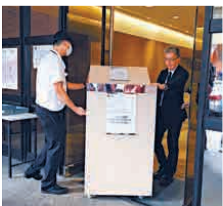
漁光村過渡屋昨截止申請

家庭申請表，另有26份申請不符合資格。按各類單位數量計算，單身長者平均約2.6人爭一間單位，二人家單位平均約5人爭一間，三人家單位平均約11人爭一間單位。黎先生一家三口租住九龍城約100方呎的劏房，他輪候公屋近五年，抱著「博一博」心態申請，「當大抽獎！抽唔到唯有繼續等公屋」。盧先生輪候公屋八年，他稱私樓租金昂貴，希望入住漁光村，可省開支，「應付完租金，已不會有錢做其他事，或者供子女讀書」。房協將於本月24日電腦抽籤決定合資格申請人的優先次序號碼，預計最快今年底入伙。房協發言人稱，申請人只有一次編配單位機會，如放棄或獲邀而沒出席編配單位程序，申請將會取消。