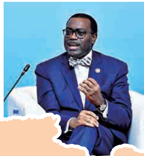
▲塞內加爾達喀爾大學孔子學院的學生在聽寫漢字