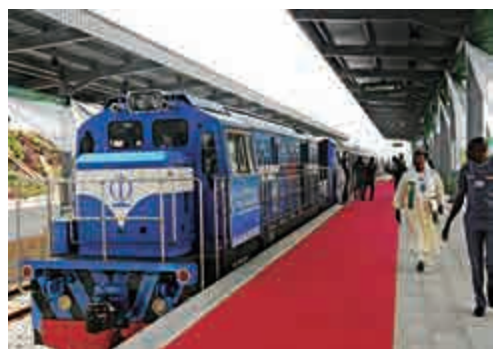
▲由中國公司承建的尼日利亞首都阿布賈城鐵7月正式開通

資的主要來源，中國企業家活躍在農業、製造業、服務業甚至酒店和旅遊業等不同產業。」海盧強調說。