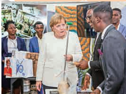
►德國總理默克爾(左)8月30日到訪加納

根據該報告，英、美、法等發達國家的跨國企業，仍舊佔對非FDI的巨頭，與此同時，來自中國和南非等新興經濟體緊隨其後。預計在2018年對非FDI將上漲20%達到500億美元左右。