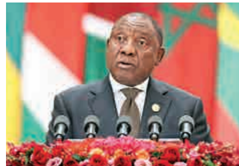
▲拉馬福薩4日在中非合作論壇開幕式上致辭