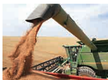
▲美國華盛頓州小麥等農產品將因關稅至少損失4.8億美元 資料圖片

目前，已有100多個國家和國際組織以不同形式參與「一帶一路」建設。中國日益成為新理念提出者、新模式探路者和全球公共產品提供者，助力提高生產要素跨境配置效率，促進世界經濟發展。