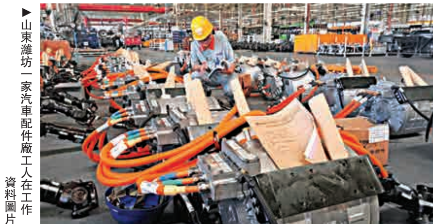
▲山東濰坊一家汽車配件廠工人在工作 資料圖片