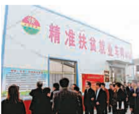
▲圖為民營企業家代表參觀鄂城縣精準扶貧就業車間

「萬企幫萬村」行動由全國工商聯、國務院扶貧辦、中國光彩會於2015年10月發起，以民營企業為幫扶方，以貧困村、貧困戶為幫扶對象，目標是用3到5年，動員全國1萬家以上民營企業，幫助1萬個以上貧困村加快脫貧進程。截至今年6月底，參與民企達5.54萬家，精準幫扶6.28萬個村，幫助755.98萬建档立卡貧困人口。今年10月，全國工商聯、國務院扶貧辦等單位首次開展「萬企幫萬村」行動先進民營企業表彰活動，將連續開展三年，每年表彰100家企業。（記者 張寶峰）