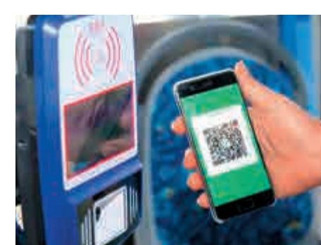
▲乘車碼支付成為內地居民乘坐公共交通的支付新寵

【大公報訊】記者毛麗娟深圳報道：騰訊金融科技智庫21日發布《國人智慧出行報告》（以下簡稱「報告」）。報告顯示，國人智慧出行服務總體使用程度較高。在公共交通方式的選擇上，乘車碼發展迅速，成為公交支付新寵。報告還為全國20個城市編製了城市智慧出行指數，其中深圳居全國首位，且乘車碼使用率高達79.82%，居全國第一。據悉，騰訊乘車碼服務目前已覆蓋北京、深圳、上海、廈門、寧波、濟南、大理等上百個城市，支持BRT、公交、地鐵