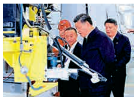
▲習近平在遼寧忠旺集團生產製造車間參觀

習近平強調，支持民營企業發展，是黨中央的一貫方針，這一點絲毫不會動搖。希望廣大民營企業家把握時代大勢，堅定發展信心，心無旁騖創新創造，踏踏實實辦好企業，合力開創民營經濟更加美好的明天，為實現中華民族偉大復興的中國夢作出新的更大貢獻。