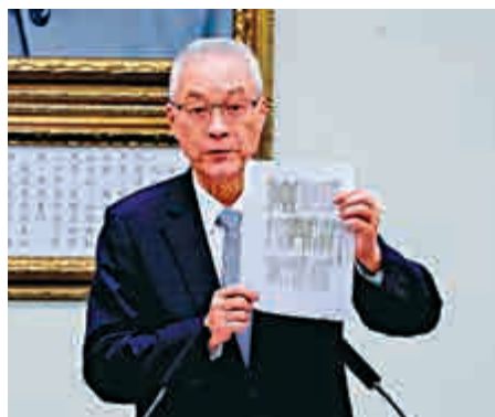
▲國民黨主席吳敦義展示文件，指蔡英文曾承認「九二共識」

據中央社報導，國民黨舉行兩岸城市交流閉門會議，黨籍縣市長出席踴躍，會後也列席中常會，包括新北市長侯友宜、高雄市長韓國瑜、新竹縣長楊文科、南投縣長林明濤、彰化縣長王惠美、花蓮縣長徐榛蔚、台東縣長饒慶鈴、澎湖縣長賴峰偉、金門縣長楊鎮浚、雲林縣長張麗善等10位親自出席。台中市長盧秀燕、苗栗縣長徐耀昌則由代理人出席，宜蘭縣長林姿妙、連江縣長劉增應2人未出席，嘉義市長黃敏惠僅出席中常會。