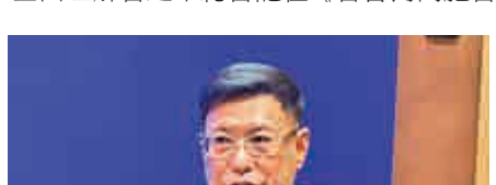
▲解放軍中將何雷表示，解放軍有能力捍衛國家主權完整

【大公報訊】記者張寶峰北京報導：在國新辦9日舉行的吹風會上，軍事科學院原副院長、解放軍中將何雷表示，只有全面理解習近平總書記在《告台灣同胞書》發表40周年紀念大會上的講話，才能正確認識大陸對台的基本方針。