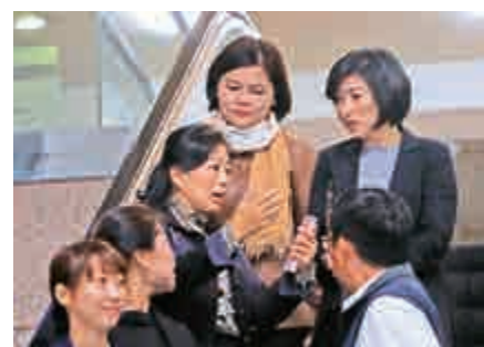
▲國民黨縣市長就會議內容交換意見

【大公報訊】據中社社報：中國國民黨主席吳敦義9日邀集15位黨籍縣市長開會，在隨後的中常會致辭時說明國民黨的兩岸政策立場。會後有藍營縣市長主張，提兩岸「九二共識」，不要再談「一中各表」。