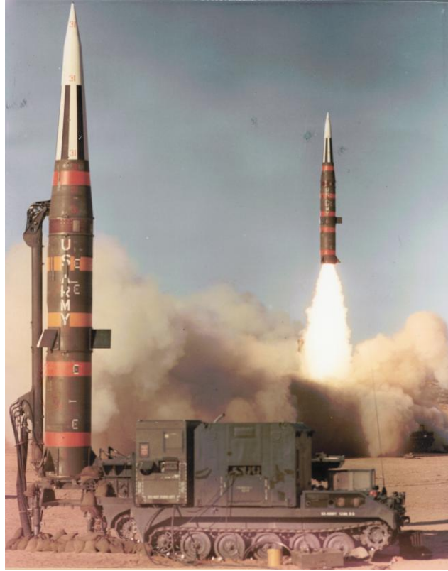
美国的战术核武器能炸到苏联，苏联的战术核武器却会砸在美国的盟国头上

另一方面，盟国也尽量避免自己的国土成为战场。美国试图撕毁《欧洲中导条约》，重新研制和部署中程导弹和陆基巡航导弹，以反制俄罗斯，遭到欧洲盟国悄悄但坚决地反对。美国试图研制低当量核武器的企图也得不到盟国的支持。中程导弹、陆基巡航导弹和低当量战术核武器的基地都在盟国。盟国不掌握发射控制权，还把自己的国土变成潜在敌国中程导弹、巡航导弹、低当量（甚至高当量）战术核武器的首选目标，这是没事找灭门的节奏。