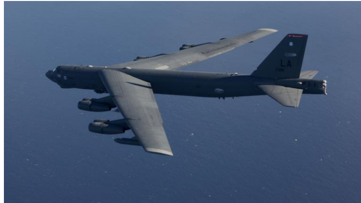
最新的一架 B-52 轰炸机于 1962 年 10 月 26 日出厂，至今已经超过 55 年了

国作战飞机的平均机龄已经高达 27 年，其中轰炸机、加油机更高，理论上可能出现祖孙三代开同一架飞机的情况。B-52 如果按计划服役到 2040 年的话，更是可能出现四代同机的奇观。