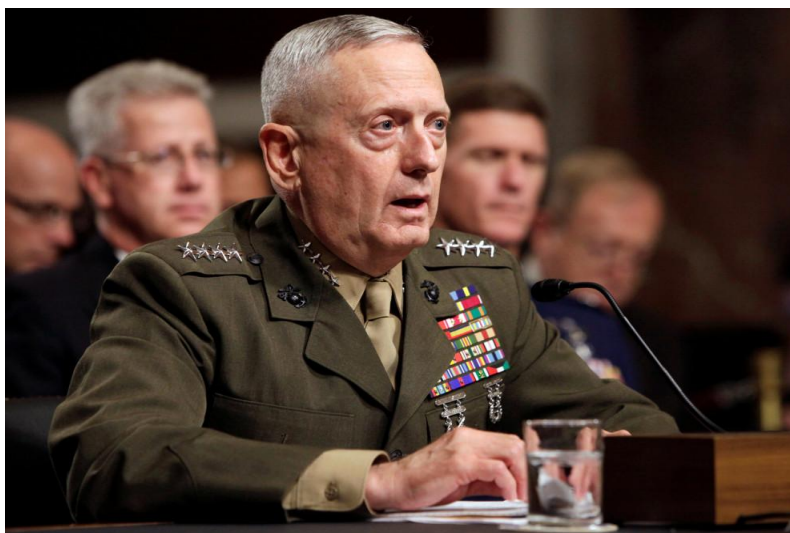
马蒂斯：什么是美军最大的敌人？！——是缺钱！

美国国防部长马蒂斯当天在约翰·霍普金斯大学的讲话中，除了对报告进行了说明，还特意指出，预算封顶和一刀切的预算裁减对美国军力的危害大于任何一个敌人，呼吁国会避免预算危机造成的政府停转及其对美国军力的进一步损害。