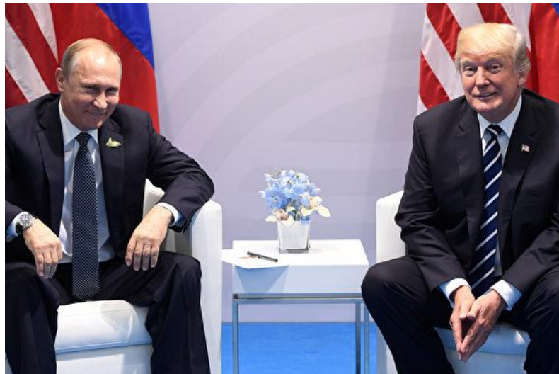
美国建制派势力发起的“通俄门”，不但撕裂了美国政坛，也使得特朗普难以缓和与俄罗斯的关系

事实上，特朗普战略对中国来说，几乎是最好情况。继续幻想美中一团和气、美国对中国的和平崛起视而不见、无动于衷，这显然是不现实的。在 2016 年大选期间，美国战略学界提出一个战略：围堵中国，策反俄国，提防伊朗。换句话说，主要敌人是中国，把俄罗斯拉拢到美国阵营，对伊朗则只要看住不使作乱就够了。如果这个战略成真，这将对对中国极端不利的。但特朗普的俄罗斯门使得美俄死结越打越深，特朗普团队和背后代表的利益集团把美国与伊朗的关系也带上重新对抗的老路，基本上宣告这个三合一战略在可预见的将来不可实现，中国的战略空间实际上还有所松动。但这是题外话了。