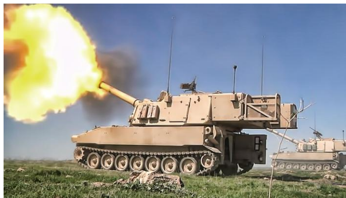
美国陆军有计划通过改装和延寿，让 M109 服役到 2050 年

在陆军技术方面，美国已经没有优势。主战坦克、步战、多种主要陆军导弹的差距已经被填平，身管火炮和火箭炮方面已经落后，好在美国战略已经不靠陆军打胜仗了。