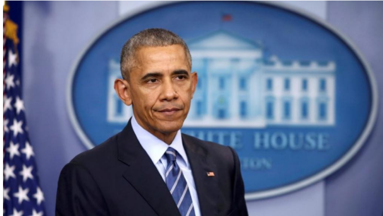
TPP 可以说是从经济上与中国竞争的一盘大棋，可惜特朗普没有把它下下去

此前之所以没有高调化，可能是在观察中国崛起的势头。现在终于确认了，中国崛起已成大势，美中的利益对抗已成事实。早在克林顿时代，美国就有意围堵中国。或许是以为中国本来成不了气候，若是因为围堵硬是逼成了对手，会不必要地造成自我兑现的预言。现在没有这个顾虑了。