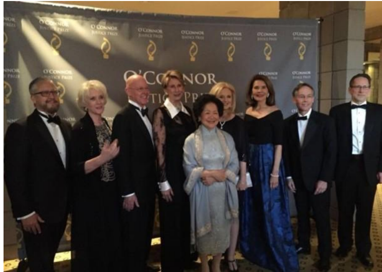
陈方安生赴美领奖

港媒12日评论称，一副攻击自己的国家而忘乎所以的嘴脸，令人所不齿，难怪有人以“吴三桂引清兵入关”来形容她的所作所为。