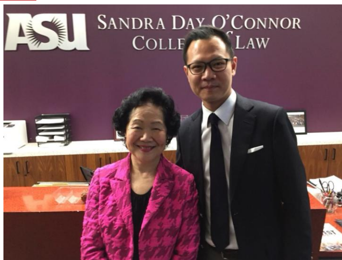
陈方安生与郭荣铿

据了解，此次陪同陈方安生前往美国的还有香港立法会公民党议员郭荣铿，两人 从本月初开始，一直在美“逗留”至今 ，不断向当地国会议员等政界人士大谈“香港民主发展的障碍”。