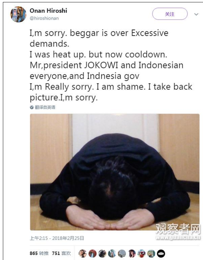
Onan Hiroshi 的道歉推特截图