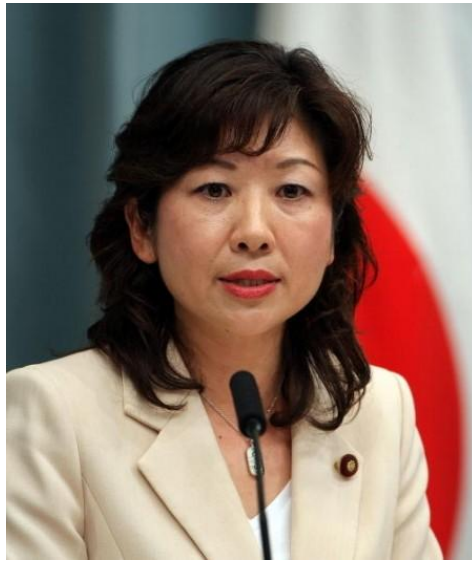
日本总务相野田圣子

报道指出，美国针对的是华为技术和中兴通讯两家企业。由于担心通信设备被用于中国政府的间谍活动，“对安全保障构成威胁”等警惕声在美国国会升温。