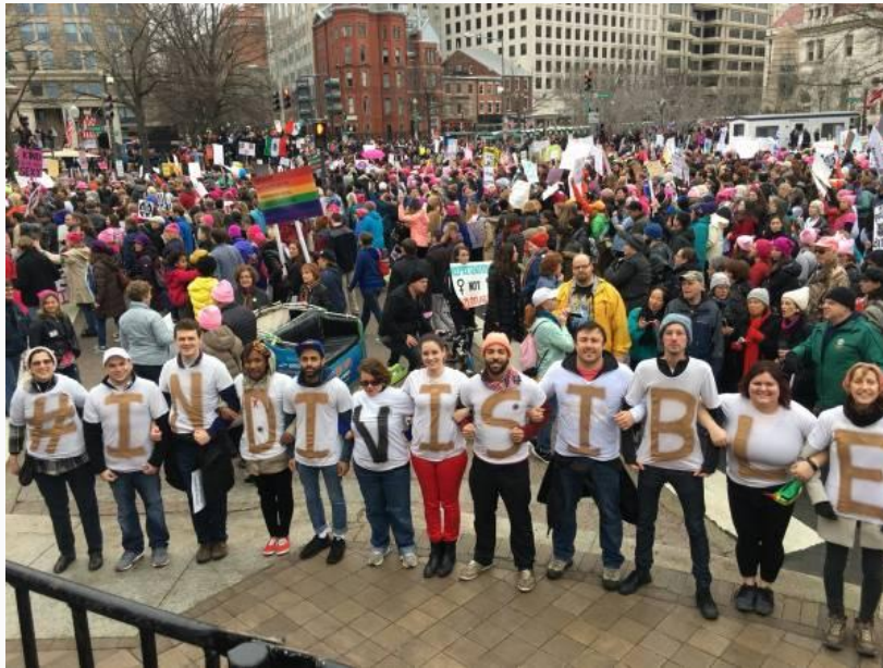
去年 8 月，西弗吉尼亚地区的“女性维权运动”抗议现场 图自推特

这几个地方在当时都是美国的“人权灾区”：4 地均在阿尔斯通团队抵达的 4 个月前（2017 年 8 月），爆发过针对特朗普政府的“女性维权运动”；因为教育经费不足，阿拉巴马和西弗吉尼亚两地正在酝酿着“教师大游行”。