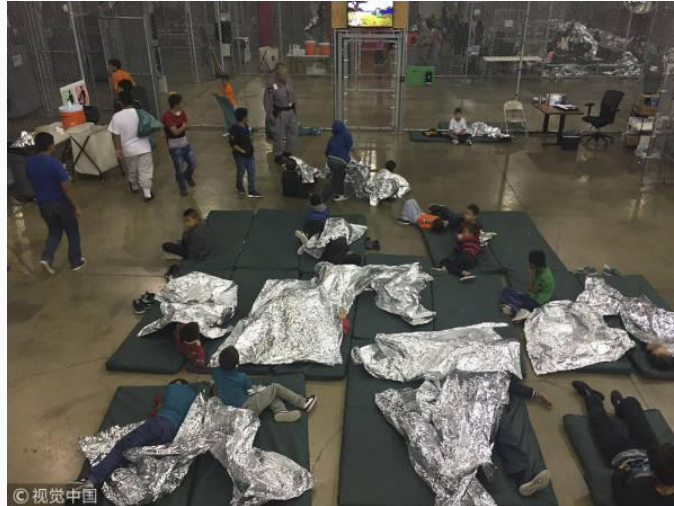
美墨边境移民儿童被迫与父母分离，“铁丝笼”里睡地铺盖锡箔纸

6月19日，美国一边宣布 退出联合国人权理事会 ，一边又在美墨边境大搞 “骨肉分离” 移民政策，引发外界的谴责。