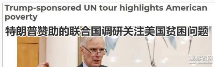
不过白宫方面并未对此进行证实。