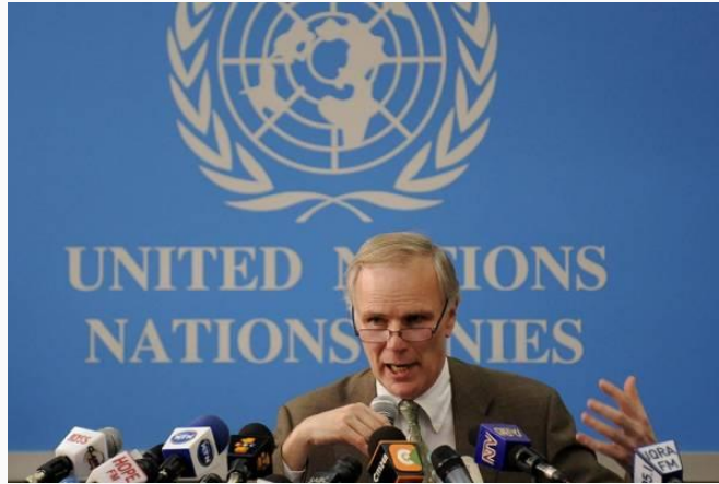
阿尔斯通

当时并不是所有美国人都对这份报告买账，一些美国媒体曾认为联合国团队引用了“ 过时数据 ”。