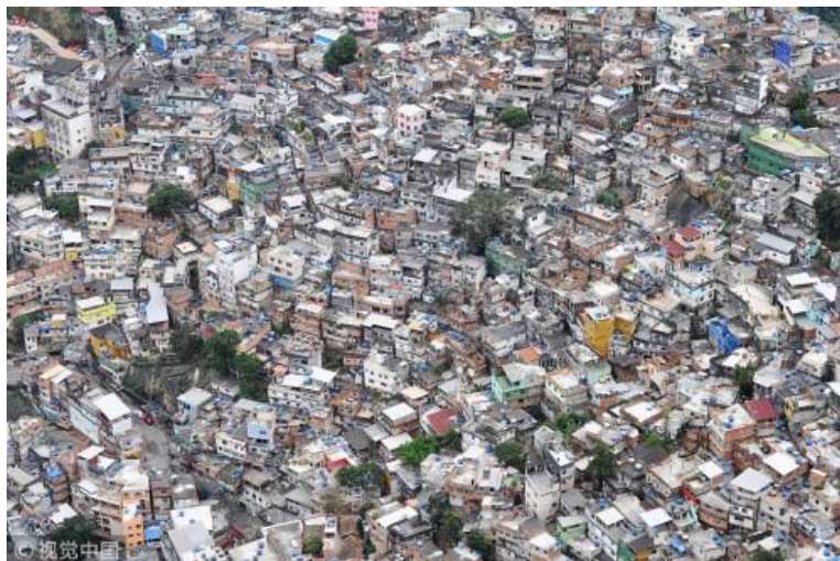
拉美贫民窟

而城里又解决不了他们的就业问题，于是贫富差距扩大，如出现贫民窟、犯罪率上升。这在拉美是非常典型的现象。