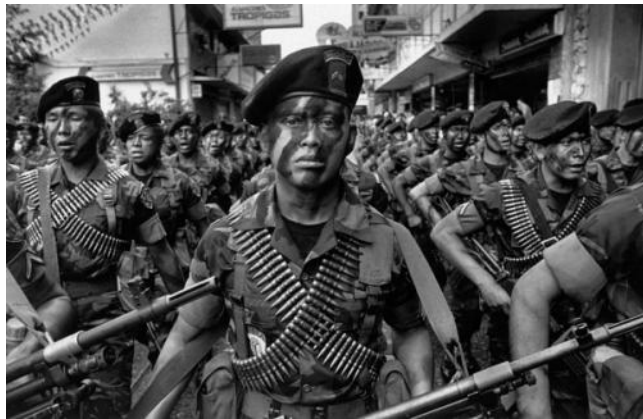
危地马拉内战（资料图）

联的班，后来古巴的力量也不够了，这些地区的游击战便逐渐停止，最后三国于 1996 年达成停战协议，解除武装，参加民主选举，逐渐走向民主化。