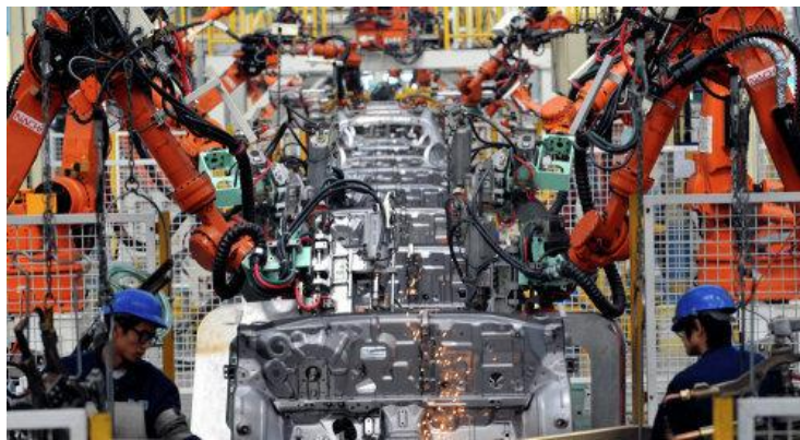
▲ 中国机器人化生产线

工业生产是个非常复杂的过程，并不是说谁掌握了高端技术就掌握了一切。即便我们还没有掌握高端技术，仅仅掌握了中端和低端技术，那也是不可替代的，只不过赚的利润不够高而已。如果只有高端，没有中低端，工业产品也制造不出来。美日欧都是在往高端这一层上挤，它们之间的竞争超过合作，零关税对它们没有什么帮助，因为工业生产的中低端环节全部都转移到中国及其他新兴经济体了，它们之间搞零关税也无助于完成整个工业生产链。