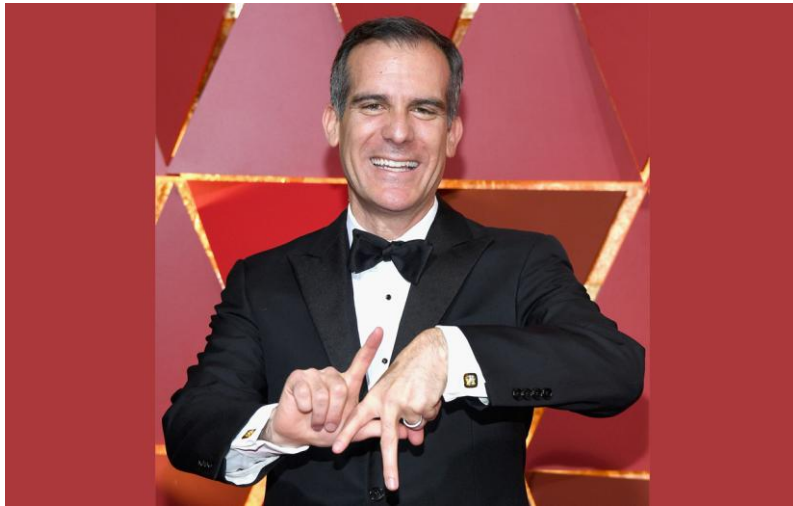
洛杉矶市长埃里克·贾塞提

据香港《南华早报》8月1日报道，正在进行“亚洲之行”访问活动的洛杉矶市长埃里克·贾塞提，在7月31日访问中国香港时表示，美国发起的对华贸易战是“愚蠢的”，洛杉矶的经济增长可能会因此降至可怜的1%甚至0，而作为中国货物的重要入口的美国加利福尼亚州南部港口，货物吞吐量将直接下降20%。