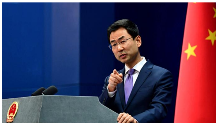
外交部发言人耿爽

7月31日，特朗普政府计划将价值2000亿美元的中国进口商品的关税从10%上调至25%，以此在贸易战的对峙中向中方施压。