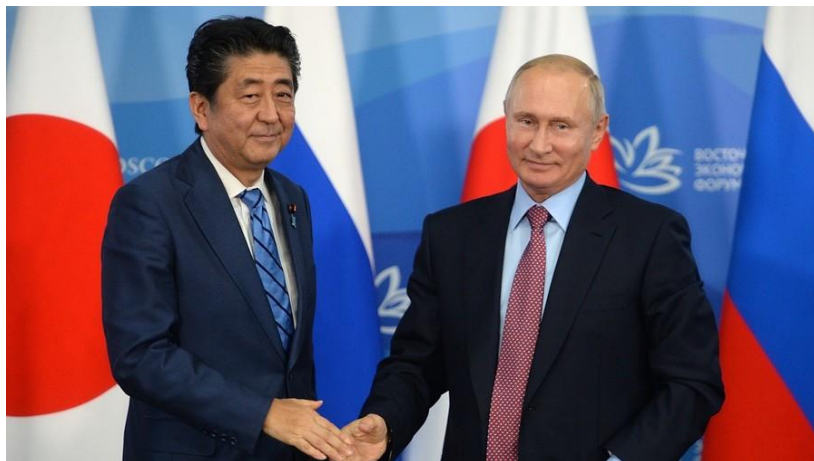
9月10日，普京会见安倍

至于日本希望尽快解决领土争端的想法，普京刚刚在10日见完安倍后表示：“太天真了”。