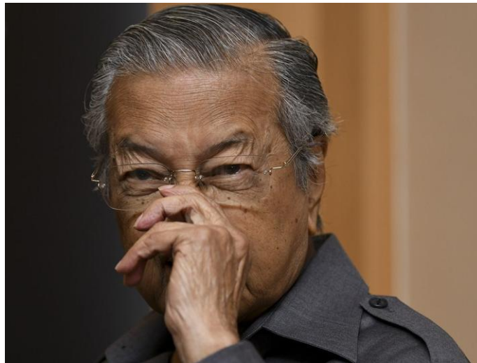
马来西亚总理马哈蒂尔

文章称，中国已登上超级大国地位，而马来西亚却博得腐败横行的恶名。“当中国为建设更强大繁荣的国家团结一致时，马来西亚却把精力消耗在无休止的内江上。”