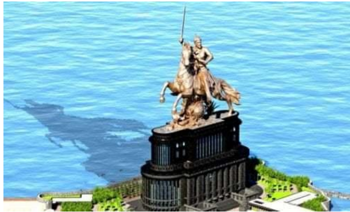
希瓦吉雕像效果图

除了这座帕特尔团结雕像外，在印度马哈拉施特拉邦，地方政府计划在首府孟买附近一人工岛上建造一座雕像，争夺“全球最高雕像”美誉。这座为纪念印度17世纪民族英雄希瓦吉（Shivaji）的雕像，原本规划高98米，但地方政府为争世界第一，将雕像的高度提升至212米。