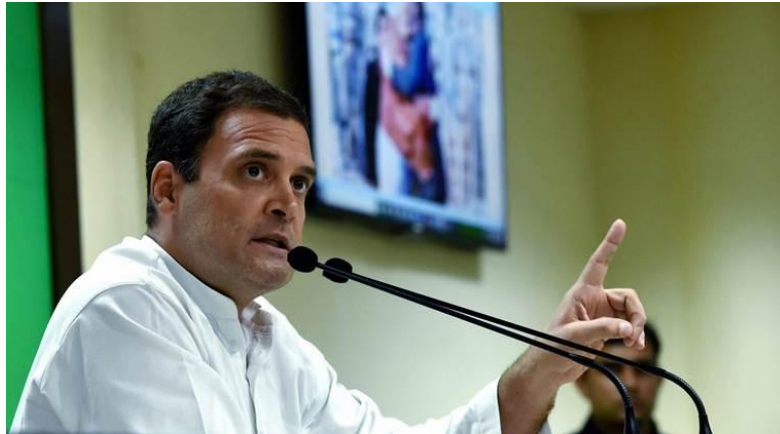
拉胡尔·甘地/图自印媒

拉胡尔当天宣称，正在建造的这座世界上最高雕像，被贴上“中国制造”的标签，而非“印度制造”，这是对帕特尔的侮辱。