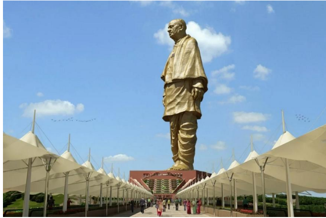
雕像效果图

拉胡尔当天宣称，正在建造的这座世界上最高雕像，被贴上“中国制造”的标签，而非“印度制造”，这是对帕特尔的侮辱。