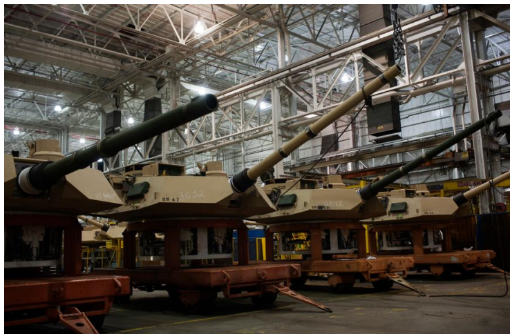
阿拉巴马州的美国坦克工厂

报告明确要求，特朗普政府需要确立一个明确，长期且统一的国防工业政策。在此之前，五角大楼仅仅保留了一个工业政策办公室，防务新闻网称，该办公室的资源和实力相当有限。同时，在报告的结论中，报告要求美国投资美国劳工部将努力加强在理工科上的投入，并采取激励措施，如减税和学费减免以鼓励更多的美国人学习数理化，以缓解目前劳工不足。