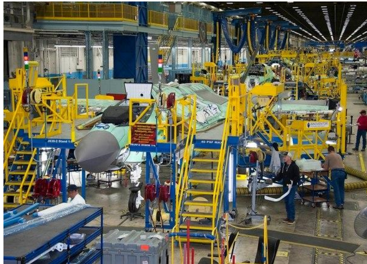
报告称，哪怕是至关重要的 F-35，也深受供应链的影响

之所以说这些层级是“薄弱环节”，报告称是因为他们往往“来源单一”，具有“不可替代性”。在有些情况下，在激光、雷达、声纳、夜视系统、导弹制导和喷气发动机所需的稀土材料方面， 中国成为了这些原材料唯一生产国。