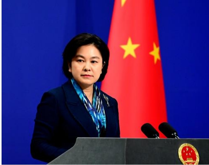
资料图：华春莹