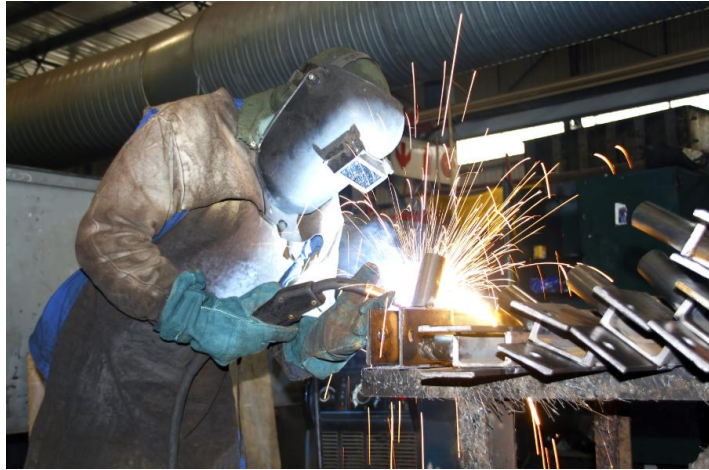
报告称，美国极度缺乏理工科技工 图为美国国防工业的一名焊工