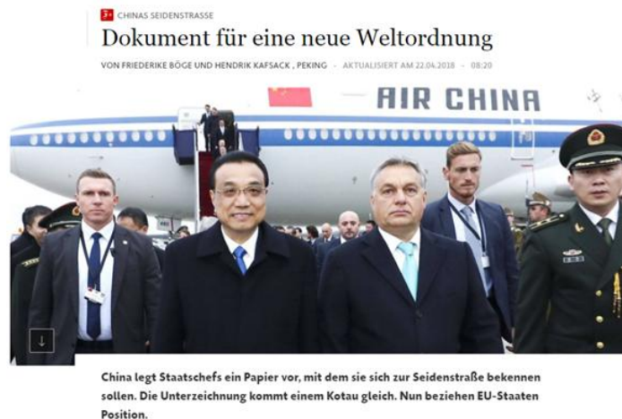
《法兰克福汇报》今年 4 月 22 日认为中国的“一带一路”倡议代表了一种新的世界秩序

《法兰克福汇报》与《明镜在线》2015 年 4 月 20 日分别撰文指出，巴基斯坦是中国“一带一路”倡议中重要的中转枢纽，尤其是中国援建的瓜达尔深水港地缘战略意义非凡。巴基斯坦方则非常欢迎中国的“一带一路”倡议投资，《法兰克福汇报》报道援引巴基斯坦政府观点称：“‘一带一路’框架下中巴经济走廊项目意义重大，能为巴基斯坦解决长期制约其发展的能源短缺问题”。报道多持中立观望态度。俄罗斯对“一带一路”的态度也是 2015 年度德媒关注的焦点。