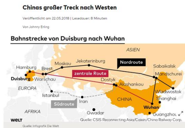
5月22日，德国《世界报》认为中国的“一带一路”倡议联通了中西方的政治经济资源，但中国地图还是使用不当

此外大多数欧盟国家没有签订“一带一路”备忘录也是各媒体报道的焦点，分析认为主要原因是在中国市场准入议题上中欧无法达成一致，因此德国媒体进一步质疑中国的“全球化”是否只是针对自己国家的全球化（《中国的单行路》，法兰克福汇报，2017.05.16）。尽管类似质疑声音较高，许多媒体认为欧洲对“一带一路”还是给予许多希望，“一带一路”倡议促进世界经济发展的潜力对包括德国在内的欧洲诸国都意味着许多机遇与商机，尤其是对“一带一路”倡议为沿线贫穷国家带来的契机进行了积极解读。