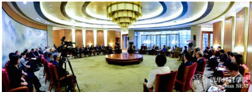
朱镕基会见清华经管学院顾问委员会委员

据清华大学经济管理学院官网消息，2018年10月12日下午，清华大学经济管理学院首任院长、学院顾问委员会名誉主席、国务院原总理朱镕基及夫人劳安，中共中央政治局委员、国务院副总理孙春兰，国务院原副总理刘延东，国务院原副总理马凯，第十二届全国政协副主席陈元在钓鱼台国宾馆亲切会见了参加清华大学经济管理学院顾问委员会2018年会议的顾问委员。