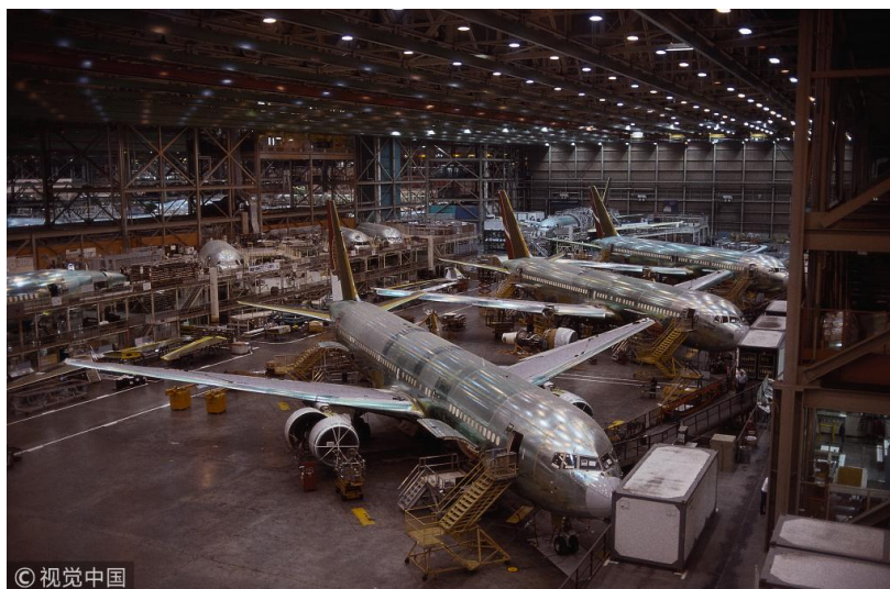
波音飞机厂

再比如波音飞机，波音现在起诉空客，因为波音认为来自于欧洲的空客拿了太多来自欧盟的政府补贴，而空客又没有否认，说当然了，我们拿了很多欧洲成员国政府的补贴，波音你自己也拿补贴了啊。所以这种情况下，美国实际是有点双重标准，说一套做一套，他一方面觉得创新不应该拿政府的钱，一方面自己实际上又是在拿政府的钱的。