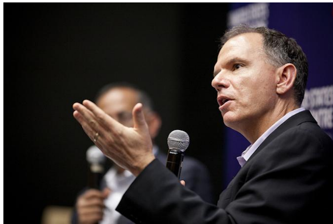
沃顿商学院院长吉尔菲·盖瑞特（资料图）

文章还分析了中美两国在国际舞台上各自的战略选择，认为美国依然按照传统的地缘政治做法，在自己盟友当中进行大量的军事力量投资；而中国则采取地缘经济的做法，通过构建共赢场景来结识新的合作伙伴。这种非对称的竞争方式，会对中美关系的转变带来何种影响？值得深思。文章经盖瑞特口述、“后E视野”整理，仅代表作者观点，特此编发，供诸君思考。