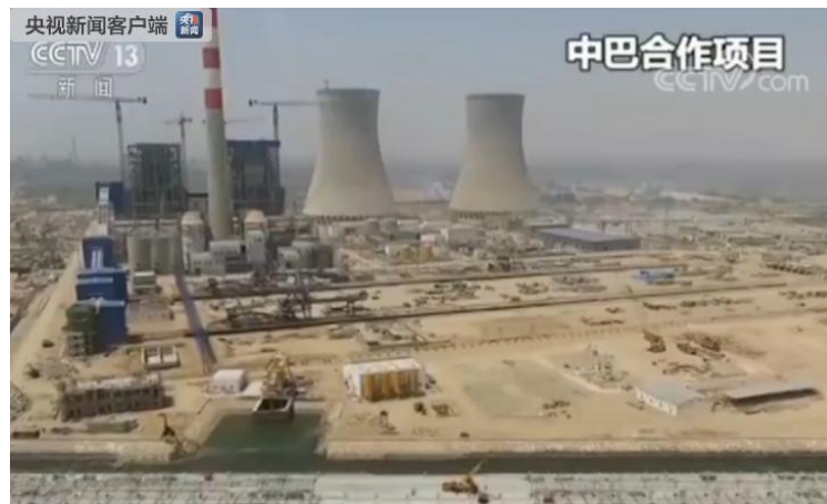
中巴合作项目

我们看到“巴中经济走廊”，这是一项价值 500 亿美元，就是 3000 多亿人民币的一项非常重要的创意。关于这个我谈两点：第一点，基础设施、道路桥梁、港口铁路等等这些基础设施的确是巴基斯坦迫切需要的，如果中国可以向巴基斯坦提供基础设施方面的支持，就会大大加强巴基斯坦的经济。不仅是巴基斯坦，其实印尼、泰国、马来西亚、菲律宾等这些国家都有类似需要，他们都非常迫切地在寻求基础设施方面的发展，而“一带一路”倡议所做的其实就是要给新兴市场国家最想要的东西，也就是基础设施的发展。