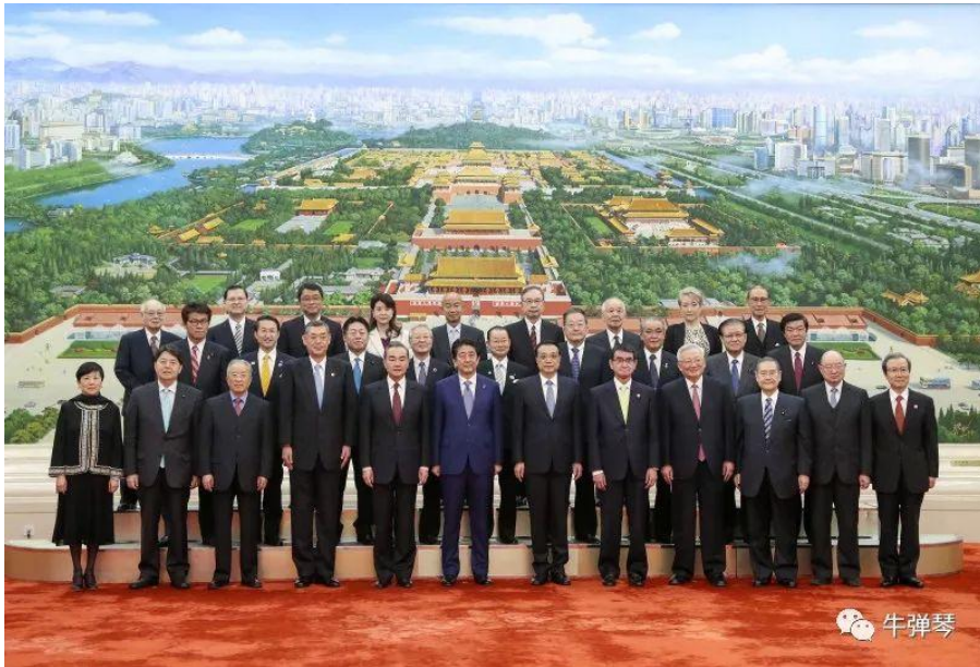
安信访华还在继续，高潮应该还在后面。但中日关系，应该就此翻开了新的一页。

以前在第三国，中日总是互掐，斗得不亦乐乎，但有时更是两败俱伤。随着中日关系的回暖，以中国的装备、人力、融资优势，加上日本的品牌、技术、管理优势，中日携手，真的可以赚世界的钱。