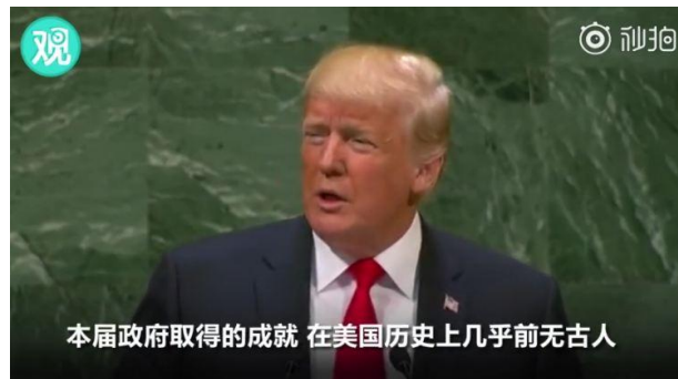
特朗普联合国大会演讲 视频截图

在指责“假新闻”的同时，特朗普自己也是谎话连篇。最近一次“著名的说谎”，是在9月25日的联合国大会上，特朗普当着全球领导人的面，吹嘘自己在2年内取得的成就超过了历史上任何一位美国总统，引得哄堂大笑。