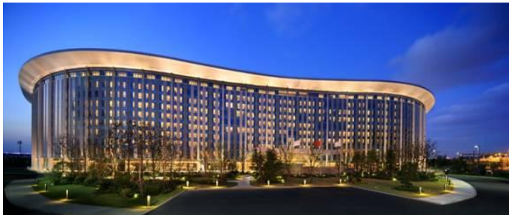
博览会会场

在上海举办的首届中国国际进口博览会，是世界上首个以进口为主题的国家级博览会。这是国际贸易发展史上的创举，也是中国塑造全面开放新格局，走向更高层次、更高水平开放的重要一步。在当前国际经济形势背景下，它是中国表明支持经济全球化、贸易自由化、市场开放化立场的庄重宣誓。