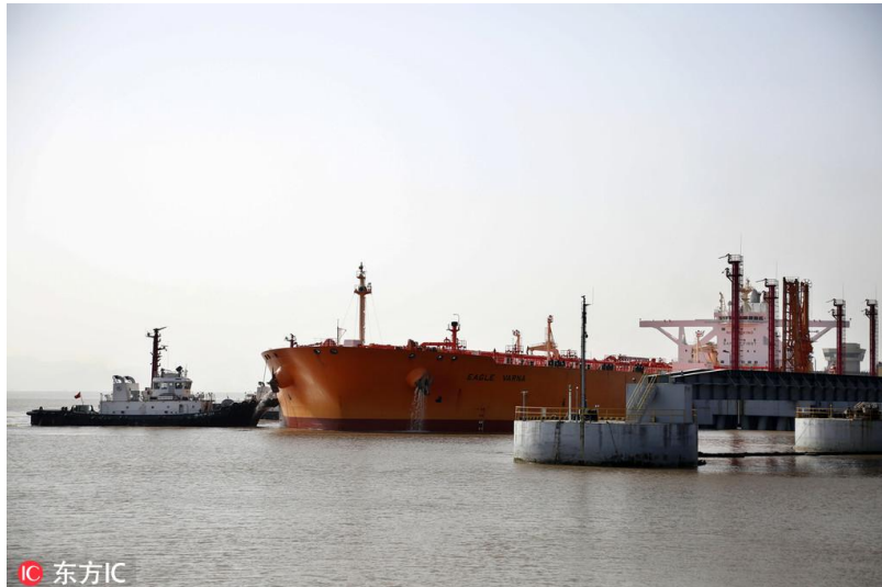
一艘 30 万吨级的新加坡籍“雄鹰 (EAGLE VARNA)”号油轮正在靠泊舟山册子岛实华原油码头

事实上，从欧洲、日本、韩国等发达经济体的实践经验看，进口依赖与经济安全并不呈严格的负相关。中国必须提升经济安全度，但提升经济安全度的路径，绝不是限制进口，而是需要提升进口渠道的多元化程度，同时加大替代产品的研发力度，改革不公平的国际经济与贸易体系，提升中国在国际产品交换中的定价权等。保持与世界的和平互动关系，维护经济全球化的环境，对中国是有利的。