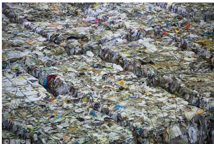
中国拒收洋垃圾，美国废物回收厂垃圾堆积如山

富国视之垃圾，一些国人却如获至宝，这背后是发展差距、理念差距、制度差距。多年来，中国不断完善海关、稽察、监管等各项进口管理制度，防堵“洋垃圾”取得一定成效。2018 年 6 月，国务院公布相关政策，明确全面禁止“洋垃圾”入境，力争 2020 年底前，基本实现固体废物零进口。人们期盼有各类专项行动进一步深化，让“洋垃圾”早日在国内灭绝。