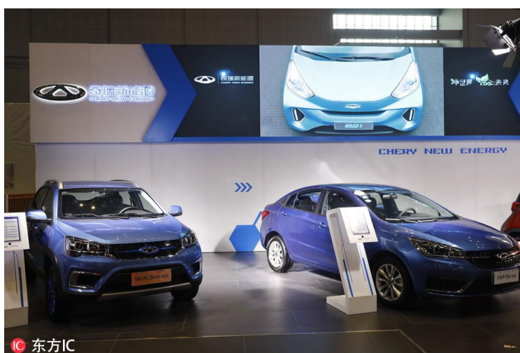
奇瑞汽车（资料图/东方 IC）

最后，要以开放胸襟看待市场与技术的关系。在对外开放市场的同时，中国的汽车现在也走向了国际市场，其中奇瑞汽车 2017 年的海外销售突破了 100 万辆。开放是一个相互的过程，技术则在互通的市场中共同演进，各方都能取得进步。