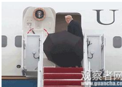
特朗普还曾因为这事儿被批：不知道收伞，一撒手就这么登上“空军一号”。

一时间，社交媒体又炸了锅。欧美网友调侃特朗普是担心弄乱头发，更有人贴出奥巴马、普京雨中纪念英雄活动照加以讽刺。丘吉尔的外孙也看不下去了，为此事发推称，“他不适合代表这个伟大的国家”。