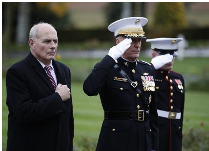
凯利和邓福德代替特朗普向阵亡美军致敬

当地时间10日，法国小雨。正在法国出席纪念第一次世界大战结束100周年活动的特朗普，因为天气临时取消出席悼念一战阵亡美军的行程，由白宫幕僚长约翰·凯利和美国参谋长联席会议主席乔·邓福德将军代替前往。