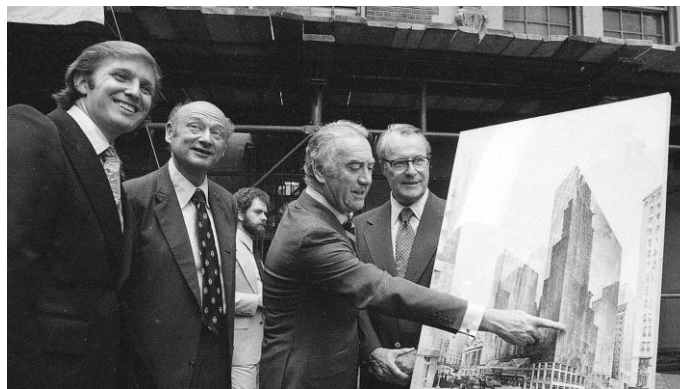
年轻时的特朗普

不得不说，社交媒体的传播技巧，很多时候凭借的是先天的禀赋。而这方面，特朗普的历练和背景恰恰得天独厚。