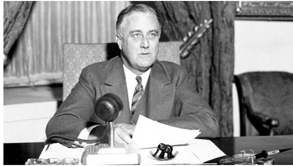
在做“炉边谈话”的罗斯福总统