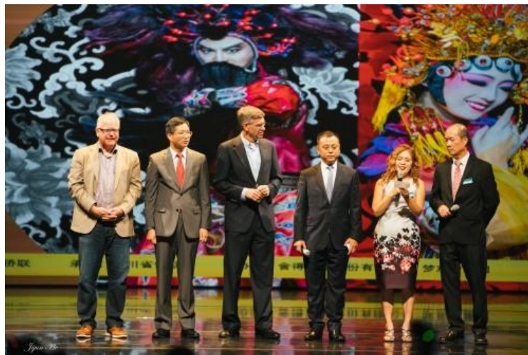
Tim Walz 先生（左一）出席《大国芬芳》巡演活动

本次明尼苏达州州长选举中，获胜的候选人来自民主党，名曰 Tim Walz，此公貌似与中国渊源颇深。今年中秋节，当来自中国的诗乐舞剧赴明州巡演时，Walz 先生受邀担任特约主持，他曾在中国当过中学教师，在现场他追忆起自己与中国的情缘，说道：“30 年前，我在广东佛山第一次过中秋节，中秋在中国文化中是阖家团圆的好日子，很高兴今天能与大家一起欣赏这场精彩的演出。中美两国有着文化交流的好传统，希望两国能友好相处。”