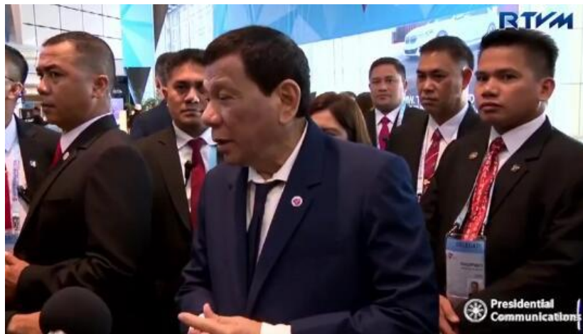
杜特尔特接受记者采访

当地时间11月15日，出席东盟峰会系列会议的菲律宾总统杜特尔特敦促美国及其盟友停止在该地区的军事演习。他告诫美国，应该正视“南海已经在中国手中”的现实，制造摩擦只会破坏中国与邻国在解决南海争端上的努力。