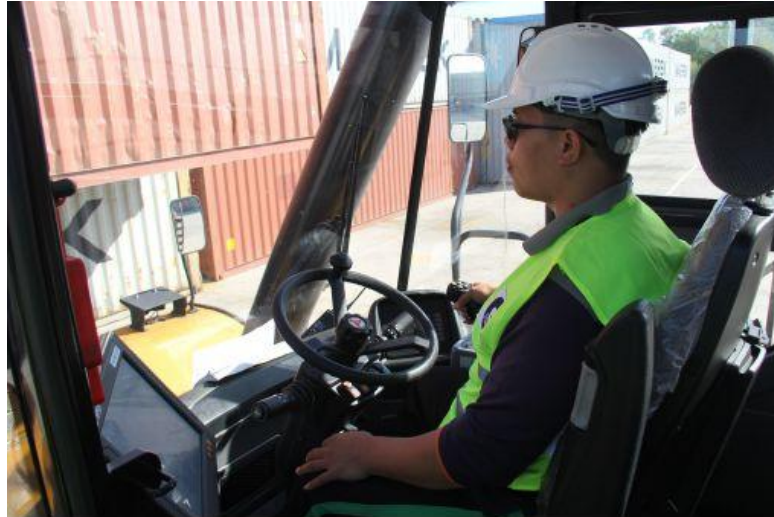
摩拉港工人正在进行集装箱装卸作业。

集装箱操作部中控主管麦克已经在这里工作多年。麦克谈起中国企业带来的变化，文莱摩拉港有限公司成立短短几个月后，就新增4台集装箱正面吊运机、3台集装箱堆高机等流动设备。“尤其是实现了从手动操作到电脑系统化管理的转变，现在司机交提柜都不用下车，通过电脑终端，就可以明确知道下一步的作业地点及作业方式。”麦克说。