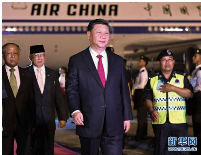
11月18日，国家主席习近平抵达斯里巴加湾，开始对文莱达鲁萨兰国进行国事访问。

据人民日报客户端11月20日消息，11月18日，习近平主席抵达斯里巴加湾，开始对文莱达鲁萨兰国进行国事访问。此系习近平主席对文莱首访，对新时期提升中文关系具有里程碑意义。