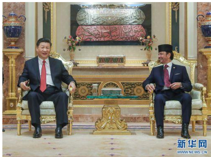
11月19日，国家主席习近平在斯里巴加湾同文莱苏丹哈桑纳尔举行会谈。

访问期间，习近平主席同苏丹哈桑纳尔举行会谈，就中文关系和共同关心的地区国际问题深入交换意见。两国元首一致决定建立中文战略合作伙伴关系，见证了共建“一带一路”合作规划等双边合作文件的签署。双方发表了《中华人民共和国和文莱达鲁萨兰国联合声明》。