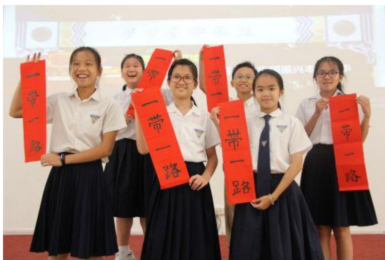
文莱中华中学学生用毛笔书写“一带一路”。

在海事博物馆里，珍藏着一艘当年往返于中文之间的商船沉船的遗物。打捞起来的瓷器、金属制品等文物诉说着当年那繁盛的贸易景象。卡里姆指着一个展品说：“这是文莱古代盛水器皿，制作时采用了中国制瓷技术，做得很精细，是中国为文莱定制的。可见在中国明朝时期，文中两国民间就有了比较深入的交流。毫无疑问，中国的先进技术提升了文莱民众的生活品质。中国船队给当地带来的是和平，留下的是繁荣。”