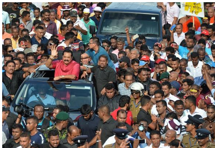
斯里兰卡民众上街示威游行，抗议政府因“一带一路”战略施加贷款背负重债，影响改革经济与社会

基础设施工程和民生经济的脱节。从中国自己的经验来看，大规模的基础设施和民生经济必须结合，才能诱发经济活动，拉动地方经济发展。有了产业园区和制造业等的发展，地方老百姓就会有就业，地方政府就会有税收。但这并没有发生在“一带一路”上，至少还做得很不够。当地的老百姓甚至地方政府的感觉会如何呢？老百姓看到土地被征用，环境被影响甚至破坏，但自己得到什么？地方政府也有类似的感觉。