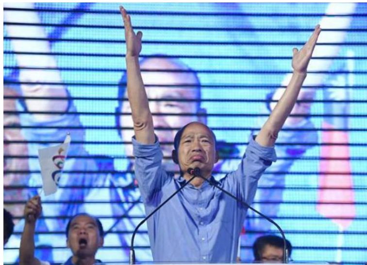
韩国瑜宣布胜选

当然蓝营执政以后也会遇到他们的问题，老百姓期待非常高，所以他们必须拿出真本事来。如果他们承认“九二共识”，愿意跟大陆交往，这当然是好事，但是它又闹不过民进党。选举激情过后回归冷静，就得面对现实，台湾的总体资源条件肯定不如以前，其实也是有风险在里面的。